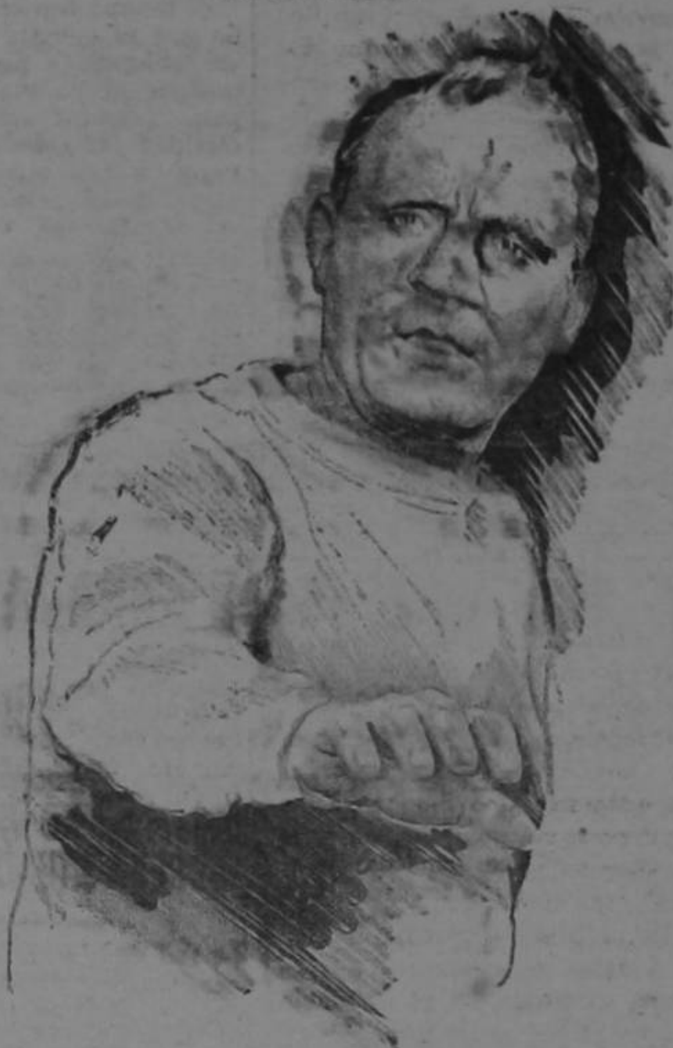
"Pat O'Brien, caracterizando a Knute Rockne en la película de la Warner Bros. titulada "Creador de Campeones"

Desde que comencé a actuar en el teatro, siempre he tenido por costumbre aceptar las obras que se me han encomendado y tratar de realizarlas lo más que he podido estudiando sus posibilidades y sus variadas fases; pero nunca me había empujado decididamente en que se me confiara un papel determinado, pues se que cuando un actor solicita caracterizar un personaje, se espera siempre de él más de lo que en realidad puede hacer.