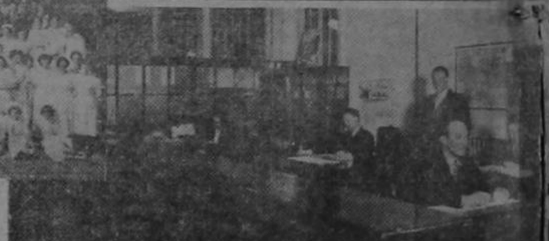
Izquierda: el personal de la fábrica argentina, en su edificio de Buenos Aires. Derecha, arriba: los tanques de depósito de la fábrica matriz, en New Haven; y, al pie, una vista parcial de las oficinas chilenas, en Santiago.